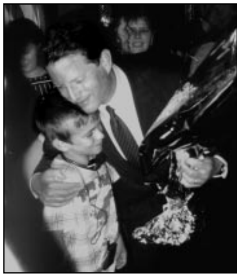
Символічний момент після прес-конференції: Альберт Гор дарує квіти хлопчик з Чернобиля

фотографіями дітей, що страждають на рак щитовидної залози: «Що сталося з цими дітьми – дітьми Чернобиля? Їхні обличчя запитують у нас – чи стане ця аварія останньою, чи лише однією з перших?»