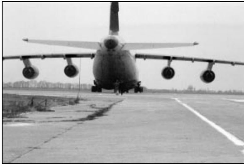
АН-124 (Руслан) привіз на своєму борту понад 70 тон медичного вантажу, сумою 3,5 млн. доларів США

Ось вже десять років Фонд Допомоги Дітям Чорнобиля виконує свою місію, щодо допомоги хворим дітям України. Цього разу Фонд організував свого роду ювілейний – двадцятий рейс допомоги на Україну. У листопаді цього року на вантажний термінал Міжнародного аеропорту Бориспіль прибув з Америки АН-124 (Руслан), на борту якого було 70 тон допомоги. Початково цей вантаж призначався для 18 лікарень у 6 містах України.