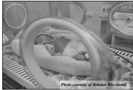
Photo of the donated incubator cradling the life of the child.