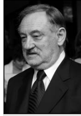
Actor B. Stupka